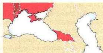
CCD (Communauté de choix démocratique)