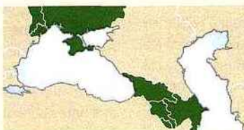
PEV (Politique européenne de voisinage)