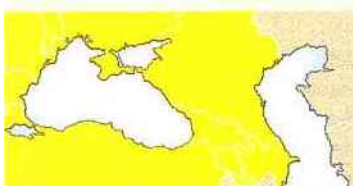
OCEMN (Organisation de la coopération économique de la mer Noire)