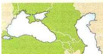
Synergie de la mer Noire