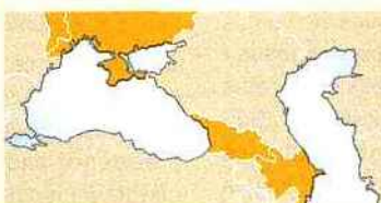
Organisation pour la démocratie et le développement économique-GUAM