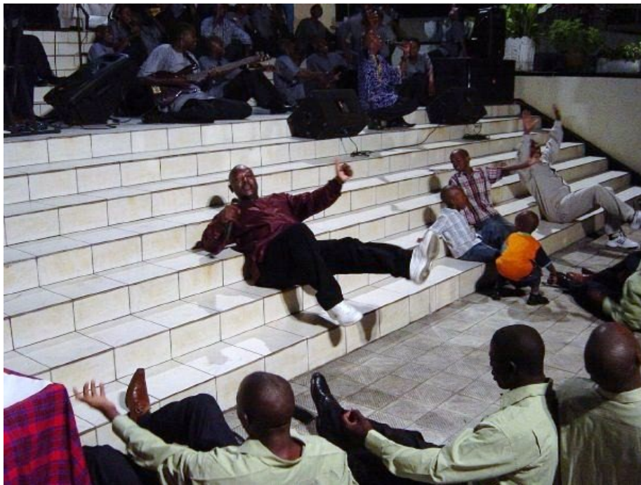
Bujumbura News, février 2015

Si de 2005 à 2015, l'image construite par Pierre Nkurunziza était celle d'un président populaire, ces dernières années la figure présidentielle subit un processus alternatif de sacralisation. À travers une utilisation particulière de l'espace physique et symbolique, la récupération de certains éléments de la tradition monarchique et l'exploitation de la religion, la figure de Pierre Nkurunziza a adopté des qualités supérieures et s'est éloignée de la masse populaire. Cette note analyse ce processus de sacralisation qui combine des éléments traditionnels et des éléments modernes. Ce processus n'est toutefois pas total, il permet encore des contacts, même très rapprochés, entre le « sacré » et le « profane ».