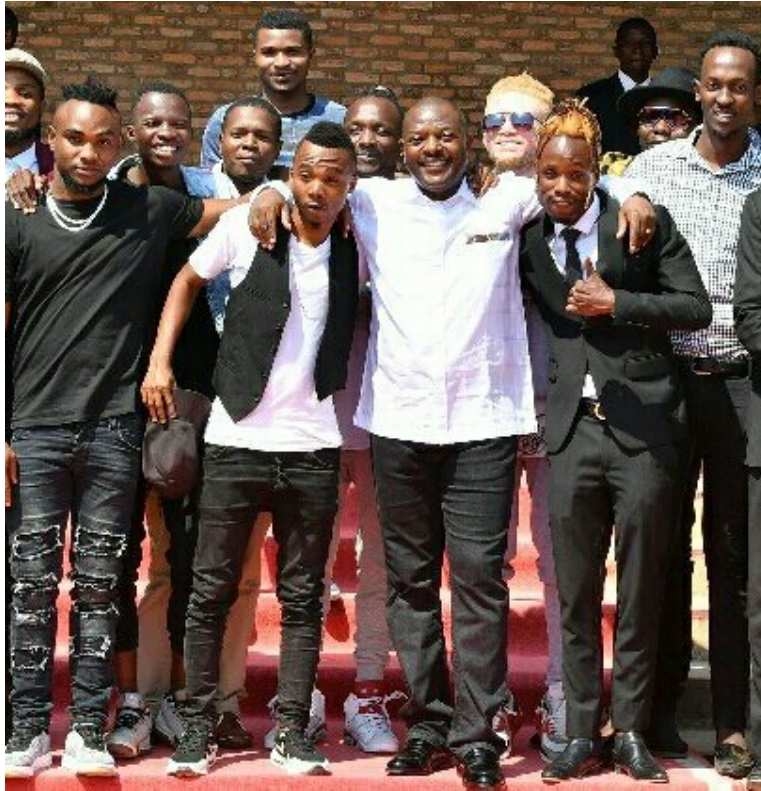
Compte Twitter de @Claudenshim , Conseiller et Rédacteur en Chef à la Présidence du Burundi, 21 juillet 2018

Au cours des travaux communautaires et des rencontres de félicitations, c'est le président (sacré) qui va à la rencontre de son peuple (profane), ce qui lui permet de garder sa position de supériorité. Dans le cas du match de football, la tentative des joueurs adverses d'attaquer le président était un comportement sacrilège qui devait être évité et lourdement sanctionné. De plus, ce contact parcimonieux souligne le caractère extraordinaire de l'événement et fait ainsi augmenter l'admiration pour le sacré. Quand ces contacts ont lieu avec des personnages très populaires, la stratégie de légitimation du pouvoir au travers d'eux est plus effective parce qu'à travers ces personnages le sacré peut atteindre une large partie de la population.