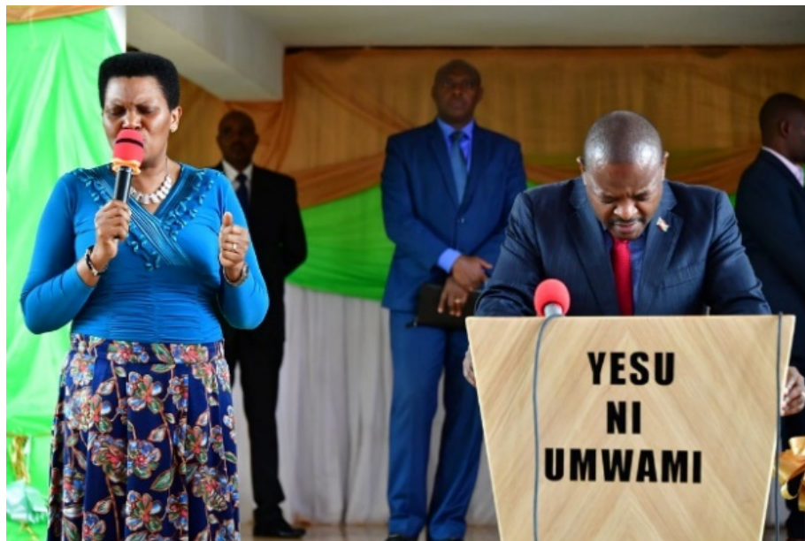
Compte Flickr de Pierre Nkurunziza, 9 décembre 2018

Parmi les activités de Madame Nkurunziza, il est difficile de distinguer les activités de première dame, de représentante de la fondation Buntu et de pasteur. Lors de croisades, prières d'action de grâce et messes dominicales, la première dame accompagne les discours de son mari avec des prêches allant dans le même sens. Comme son mari, elle anime des séances de moralisation. Le soutien de Madame Nkurunziza à son mari s'étend aux questions politiques. Le discours tenu lors de la croisade de fin 2018 représente le moment peut-être le plus intense de ce mélange du religieux et du politique 56 . Pendant ce discours, la première dame a