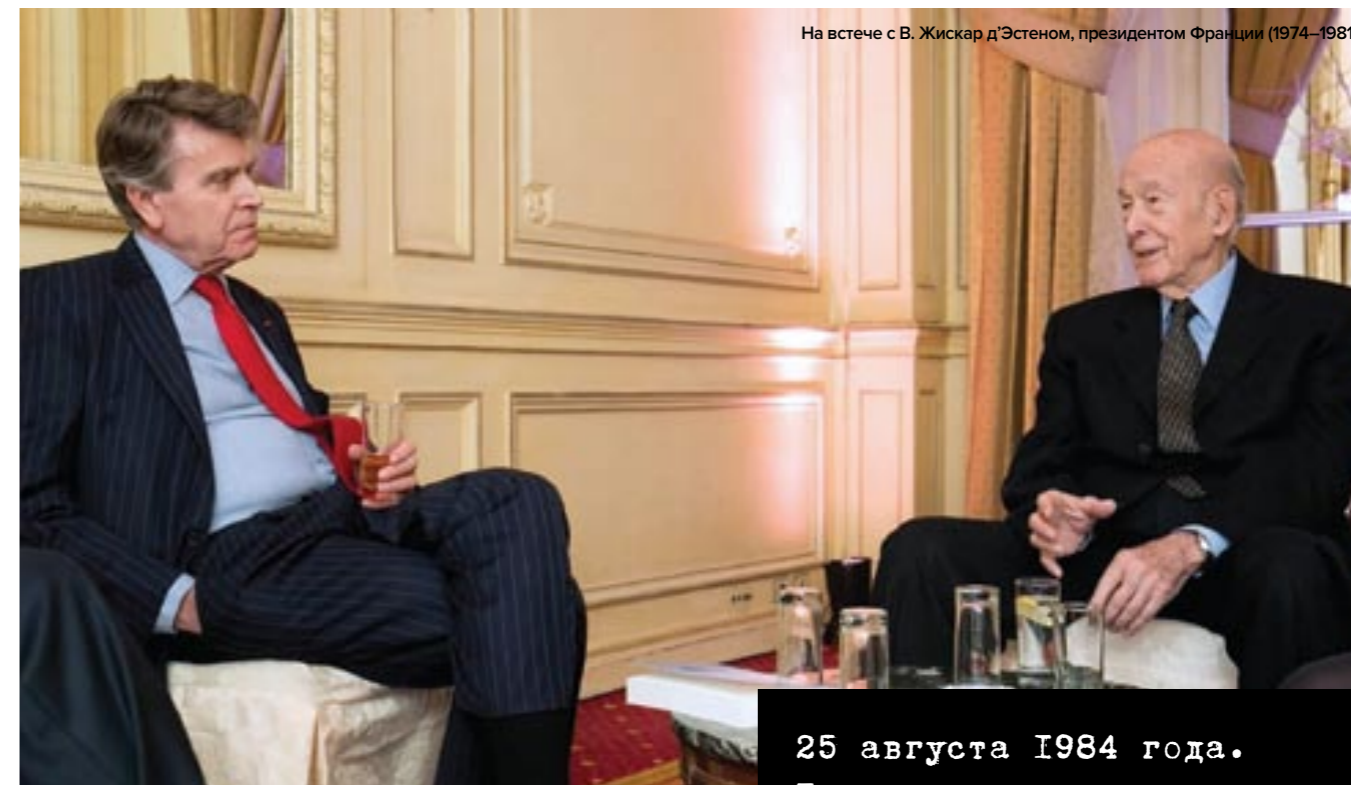
На встече с В. Жискард д'Эстеном, президентом Франции (1974–1981)

Совсем нет. Я шел к этому довольно долго. Меня всегда привлекали, с одной стороны, абстрактные научные материи, с другой — я не собирался всю жизнь копать в одном месте, мне нравилось что-то создавать. Помню, ребенком я хотел стать архитектором, а когда мне было лет 14, я уже представлял себя президентом республики. Это противоречие между