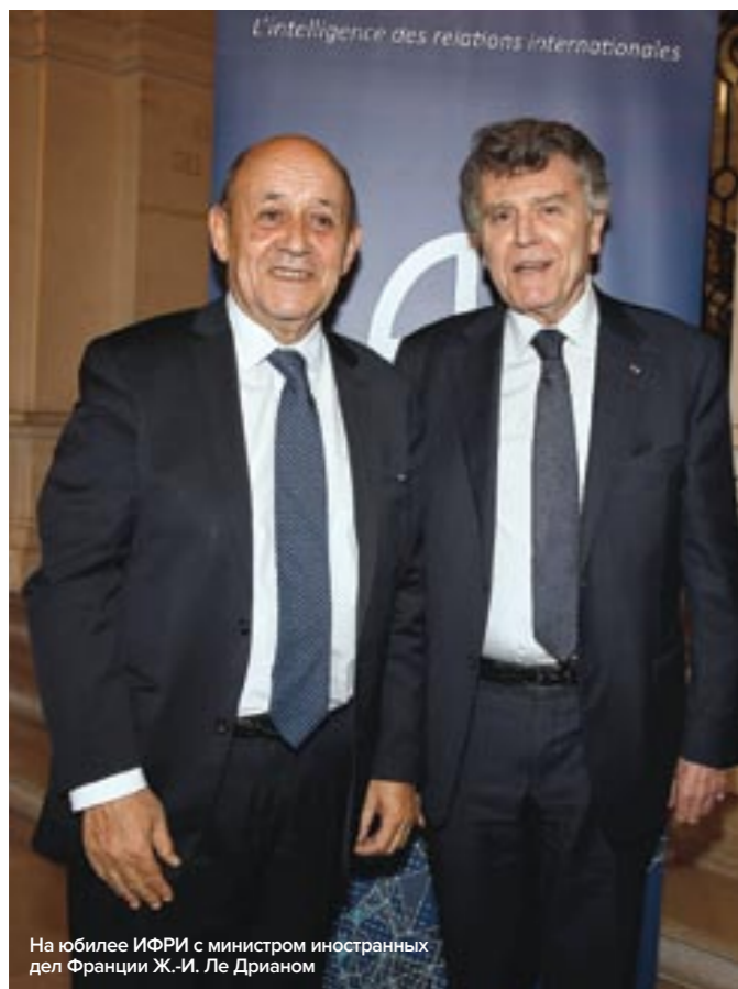
На юбилее ИФРИ с министром иностранных дел Франции Ж.-И. Ле Дрианом

Они в определенном смысле лучшее, что могла произвести советская система. Это очень хорошо образованные люди, обладающие чувством реальности и способностью поддерживать цивилизованные отношения. На примере выпускников МГИМО я всегда отмечал поразительную вещь: люди, занимавшиеся в СССР Францией, говорили на прекрасном французском, ни разу не побывав там и даже никогда не выезжая за пределы страны! Кстати, то же самое я наблюдал в Китае. МГИМО выжил, успешно пройдя через целый ряд переходных периодов, прежде всего через 90-е годы. Я прекрасно