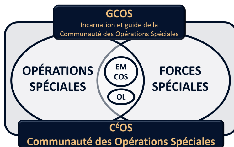
Schéma 2 : La Communauté des opérations spéciales (CéOS)