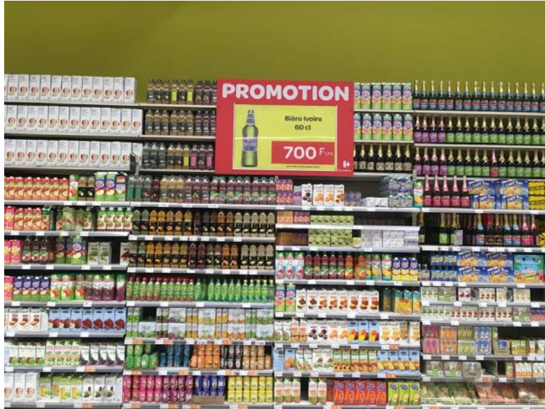
© Clélie Nallet, Abidjan, octobre 2017.