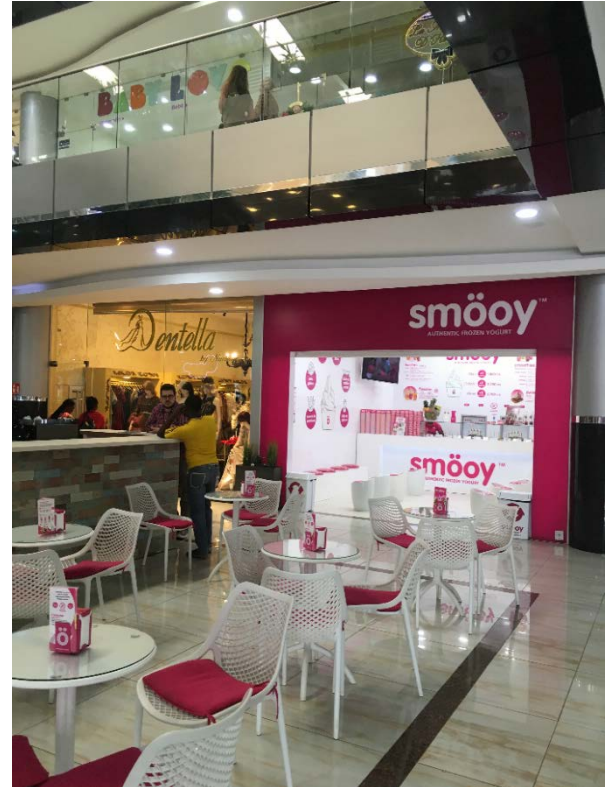
© Clélie Nallet, Abidjan, octobre 2017.

Le paysage des lieux de consommation abidjanais s'est particulièrement diversifié ces dernières années : nouveaux centres commerciaux, foisonnement de boulangeries et salons de thé, installation de nombreuses enseignes internationales et locales 11 . Cette diversification s'accompagne d'une certaine « montée en gamme » des lieux existants. Il n'est pas rare que les épiceries de proximité, communément appelées « mauritaniens », s'agrandissent et diversifient leur offre, transformant leur local en véritable supérette climatisée. Les centres commerciaux – qui ont commencé à s'implanter dès les années 1970 et se sont multipliés dans les années 1980 à Abidjan 12 – s'agrandissent et se transforment, et tendent à devenir des espaces de consommation mais aussi de vie, où se développent lieux de restauration et de récréation (espace-jeux pour les enfants par exemple), voire d'activités sportives (cours de gym collectifs 13 ). Initialement plutôt réservés aux élites et surtout aux expatriés, les supermarchés d'Abidjan ont vécu un processus d'appropriation qui les a transformés en lieux